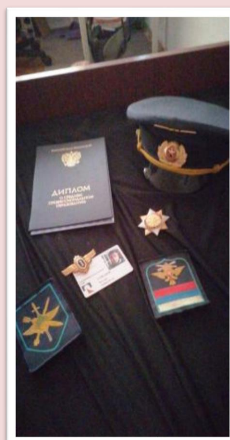
Руслан Гурбанов: «Своих не бросаем!»